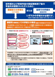
現況届の書き方・注意点

お知らせ封筒の中には、 年金をお受け取りいただくために必要な 現況届に関する大切なお知らせを ご案内しております。 内容をご確認のうえ、お手続きをお願いします。