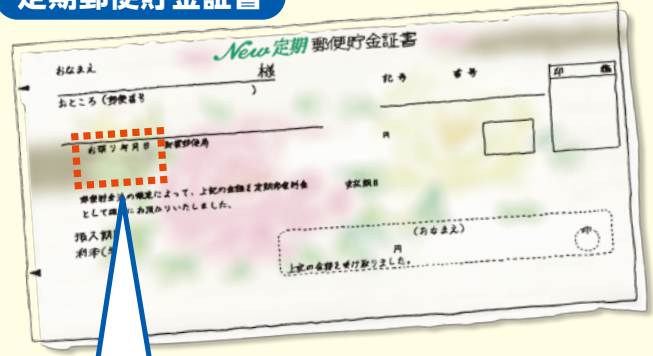
定期郵便貯金証書

定期郵便貯金は、「お預り年月日」が平成19年 9月30日以前のもは全て満期を迎えています。